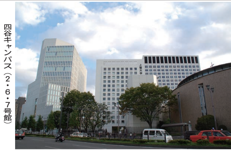
四谷キャンパス(2・6・7号館)

2014年度よりスタートしたSOPHIA未来募金(SOPHIA Future Fund)も17年度で4年目を迎え、3億8千万円ものご支援を賜りました。 SOPHIA未来募金がスタートしてから、これまでの寄付累計額は総額17億9千万円を越えました。皆様からのご支援一つ一つが、本学学生の安心・安全でより充実した学生生活・快適な学習環境の整備の実現につながっています。 その学生生活・学習環境を整備する事業のひとつとして、四谷キャンパス