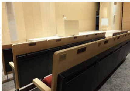
SOPHIA未来プレート募金芳名プレート

6号館(ソフィアタワー)を開始した「SOPHIA未来プレート募金」の完成を記念し2017年4月1日より受付(要参照)。本募集に、多くの方々からご寄付を頂戴し、このたび6号館1階101教室の椅子の背にプレートを設置いたしました。(写真)