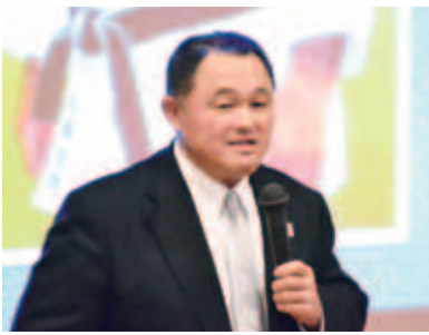
スポーツを通じた人間教育を語る

四月二十三日、創立百周年記念事業として、山下泰裕氏の講演会「スポーツを通じた人間教育」が、在学生五百六十人、卒業生その他百十人が参加した。 山下氏は、一九八四年ロサンゼルスオリンピック柔道無差別級の金メダリストで、国民栄誉賞を受賞。現在は東海大学理事で副学長。NPO法人柔道教育ソリタリティー理事長、神奈川県体育協会会長も務めている。また、ロシアのプーチン大