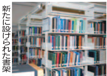
新たに設けられた書架

また、ご両親からはこのほかにも、図書館の充実のためとして多大なご寄付を賜りました。昨年は図書館に新しい書架を設け、英語